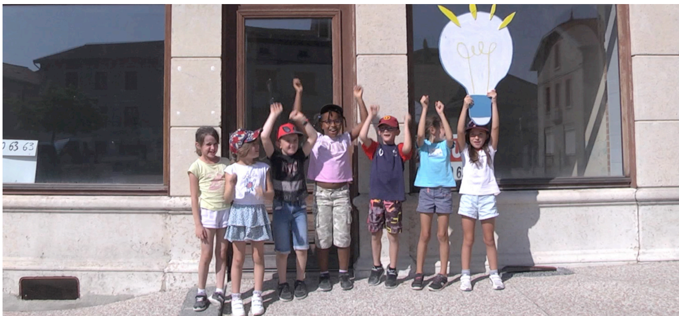
Extrait du mini-film «On a des idées» réalisé par Carton Plein avec les élèves de l'école de Périgueux Septembre 2020

L'accompagnement des deux services de Loire Forez par le POLAU a permis de renforcer une dynamique de travail transversal et de créer un discours et des enjeux communs. Cette expérimentation a également été le sujet d'un rapport d'action publique rédigé par la directrice du Réseau Culturel dans le cadre d'un master professionnel.