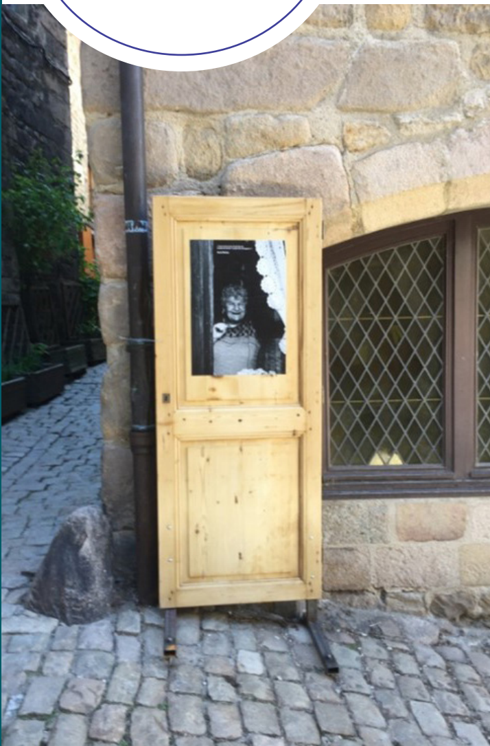
Projet «Porte à porte» à Saint-Bonnet-le-Château | 2016

Parcours des Chemins en scène et en musique coordonné en partenariat avec le Centre Culturel de Goutelas et la compagnie La Cogite