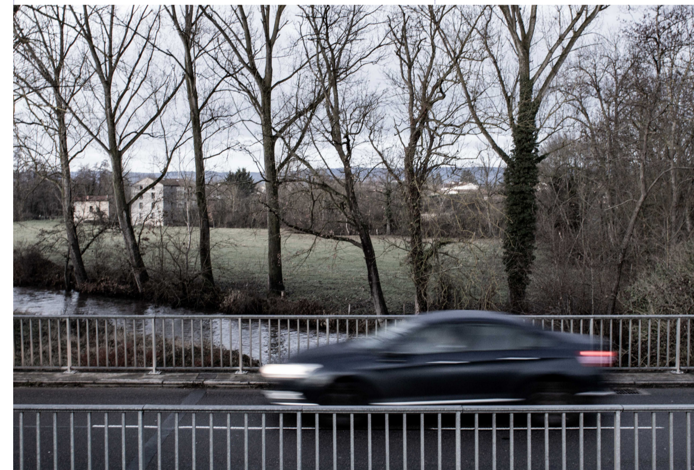
vue sur le pont de la mare depuis le pont canal