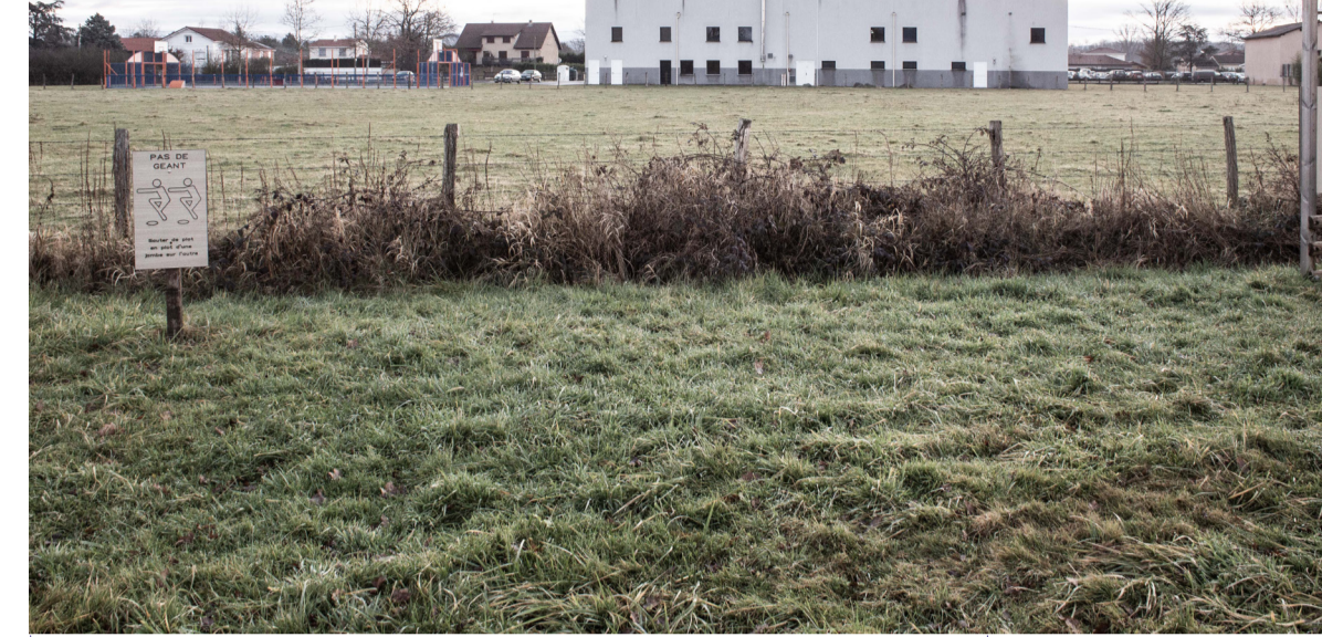
La salle Pierre Magat depuis le parcours de santé