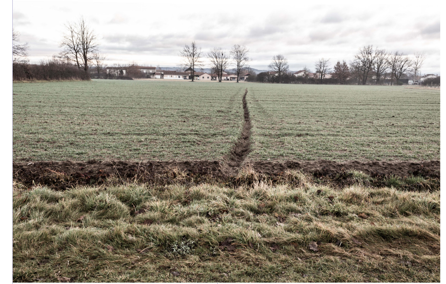
Un drain dans un champs