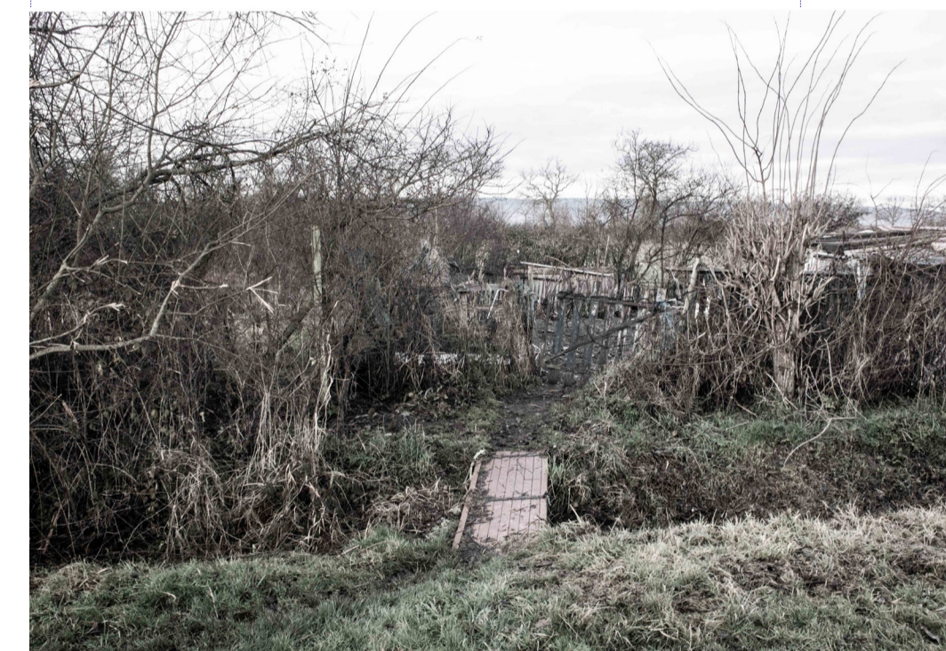
Un jardin individuel