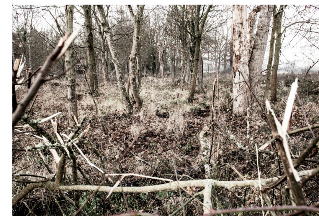
le petit bois près du stade