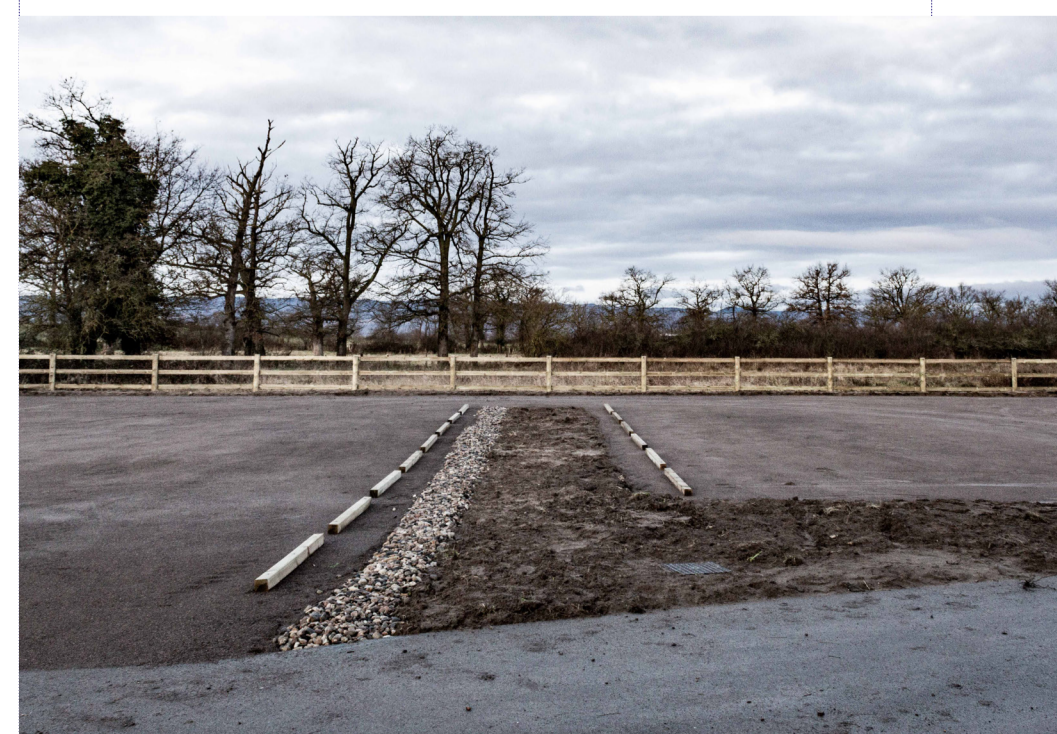
Le parking du lavoir