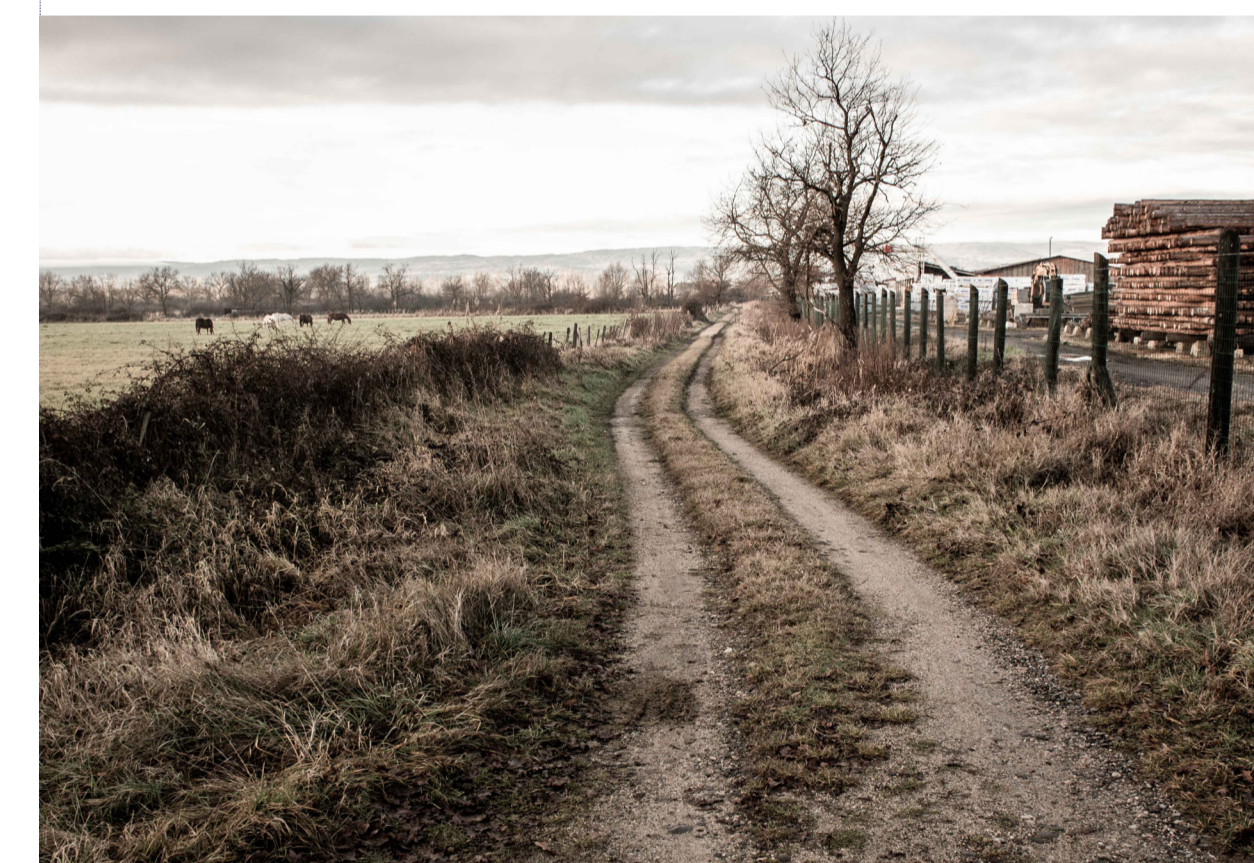
le chemin qui longe France Bois Impregnés