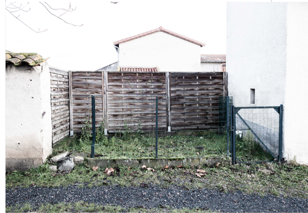
Dans le chemin du canal