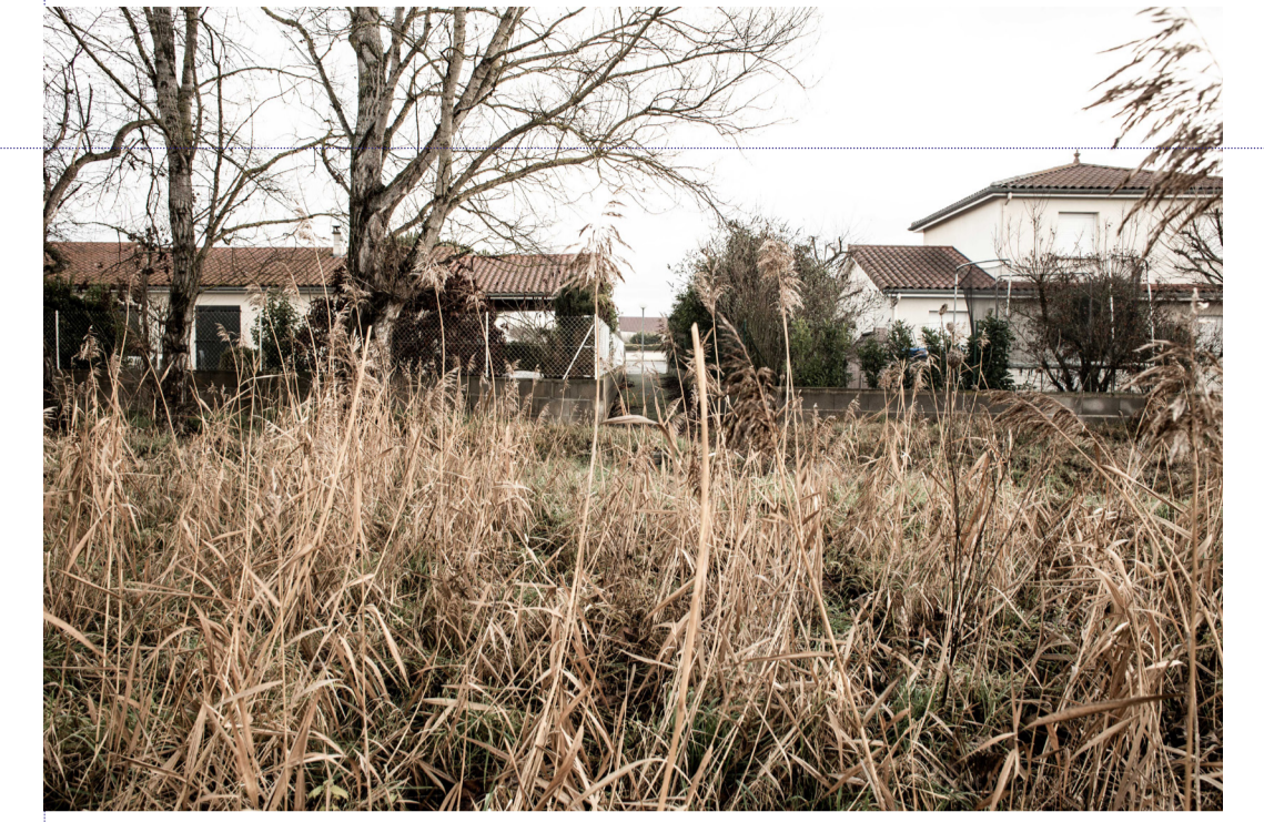
Une roselière au Cerizet