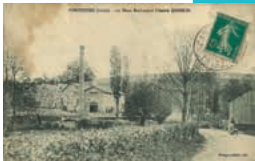
Usine Ducreux à Panissières (début 20 e s.).