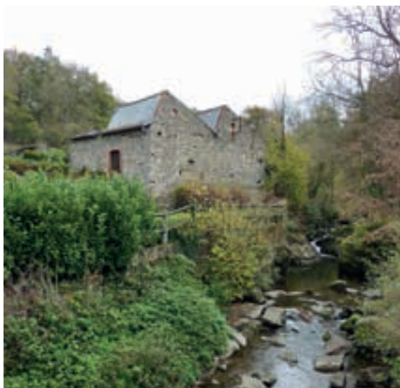
Ancienne usine Brulas, au Reynard (Cottance).