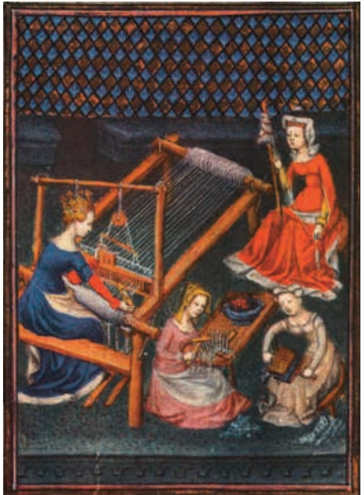
Cette miniature du 15 e siècle montre l'utilisation d'un métier horizontal à pédales, utilisé depuis le 11 e siècle.