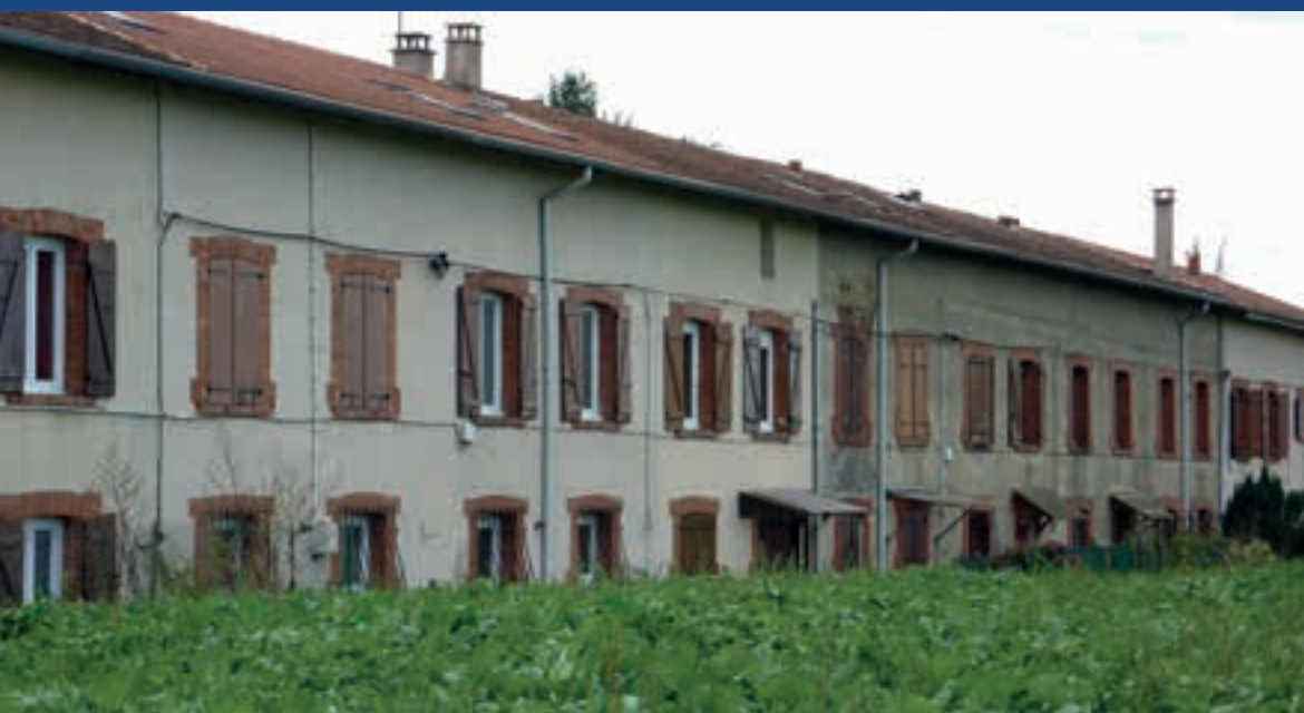
Situé à Cottance en bordure de champ à l'extérieur du bourg, ce long bâtiment appelé localement la «caserne» illustre parfaitement la conception de logements ouvriers au tournant du 20 e siècle, alignés en un seul bloc. Un petit jardinet précède l'entrée du logement organisé sur deux niveaux assez étroits. L'arrière du bâtiment que l'on voit sur cette vue dispose d'ouvertures donnant sur les champs cultivés. L'utilisation des embrasures de portes et fenêtres en brique est caractéristique de cette période.