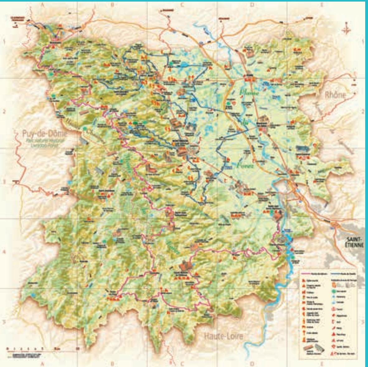
Carte Actual, n° d'autorisation 144-42/JMP/12-16.