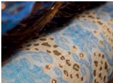
Textile à fibre optique.