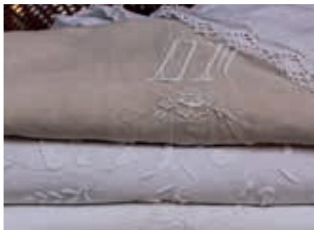
Linge brodé, musée de Panissières .