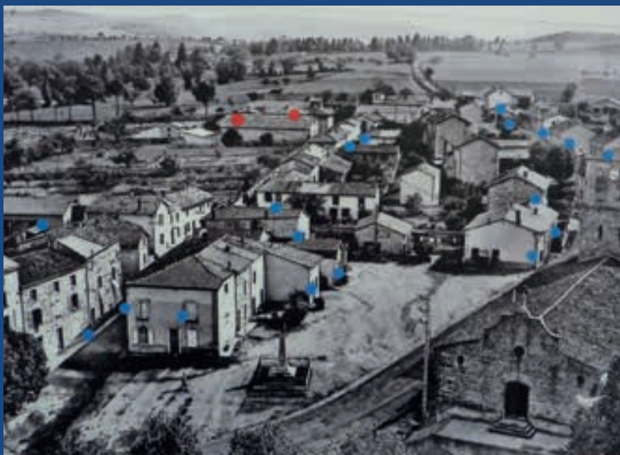
Vue du bourg de Cottance en 1960. Les pastilles bleues indiquent la présence d'ateliers de tissage particuliers, les rouges celle «d'usines de tissage». Une «caserne» ouvrière, hors champ de la prise de vue, se situe à 300 m à gauche des usines.