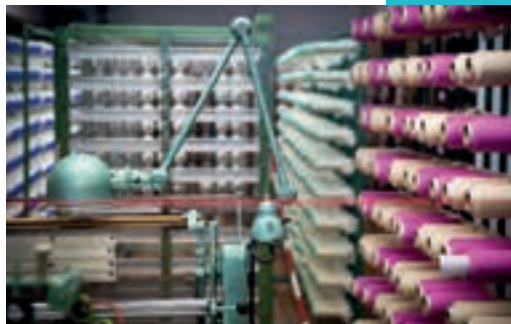
Atelier de tissage aujourd'hui