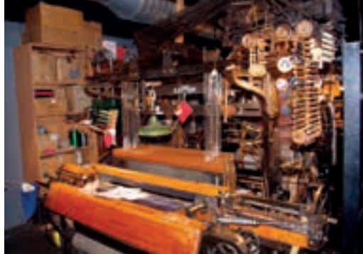
Ancien métier à tisser (Musée du Tissage et de la Soierie (Bussières).